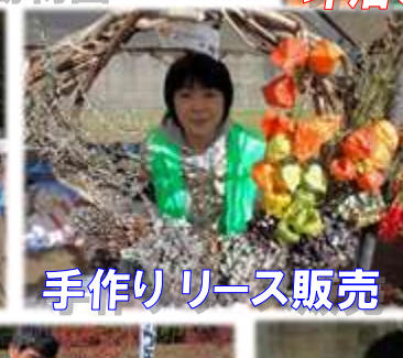
手作りリース販売