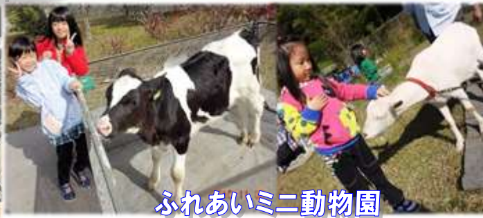
ふれあいミニ動物園