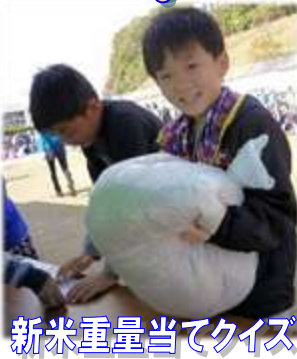
新米重量当てクイズ