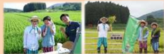
主催：仙台坪沼活性化推進協議会

山形の南陽で農家をしながら、食・農・命をテーマに活躍する「百姓シンガーソングライター」で、私たちの大親友です。気さくで明るく、とても温かい人です。大人から子供まで元気の出る、とびきり楽しいコンサートを聞かせてくれることでしょう。