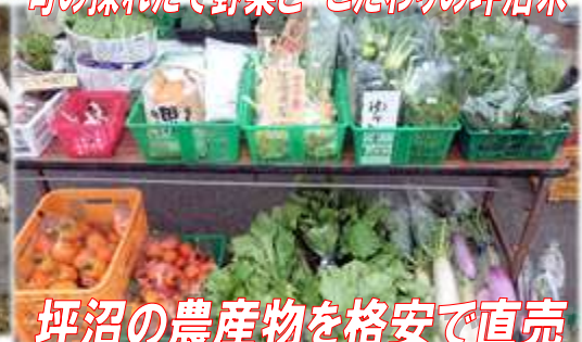
坪沼の農産物を格安で直売