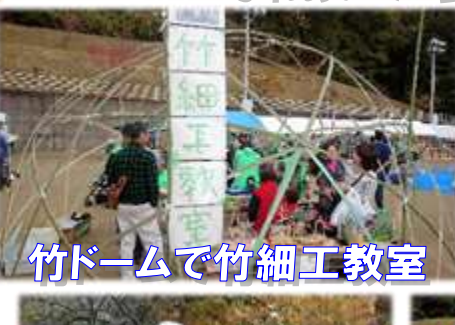
竹ドームで竹細工教室