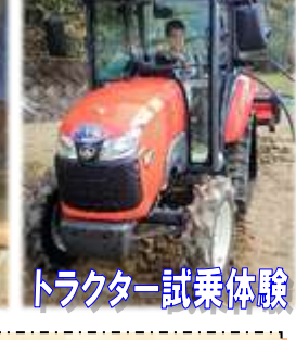
トラクター試乗体験