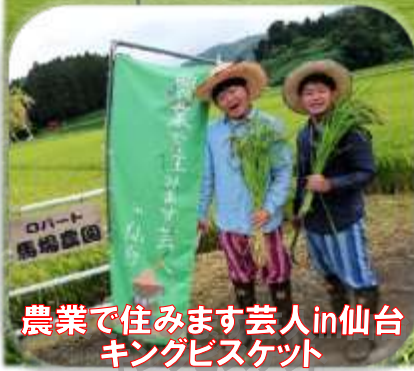
農業で住みます芸人in仙台 キングビスケット